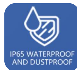
Alto grado de protección