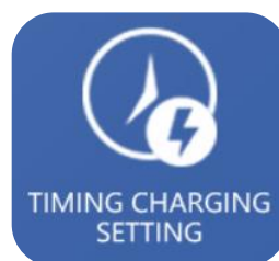
Ajuste tiempos de carga